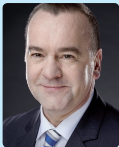
Grußwort Boris Pistorius Innenminister des Landes Niedersachsen

08:45 Uhr Die etwas andere Kongress-Eröffnung