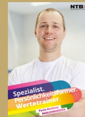
Pavlo Kirchner / TT