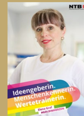
Elena Graf / TT